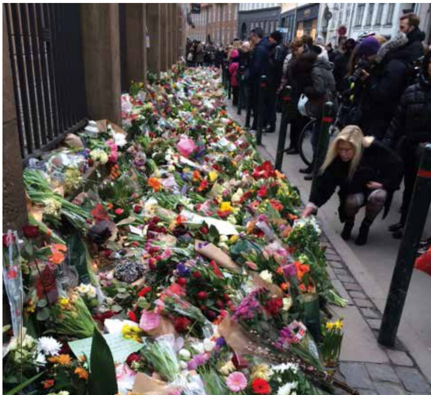
Befolkningens støtte til det jødiske samfund var stor i tiden efter terrorangrebet.