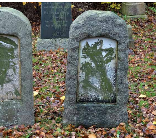
I november 2019 blev der udøvet hærværk mod en jødisk gravplads i Randers. Samtidig blev jøder andre steder i landet udsat for chikane.

»Det er enormt vigtigt for mig, at mine børn ikke hader nogen. For når vi nu var havnet der (som offer for en terroraktion, red.), så var det jo på grund af had. Det var, fordi et andet menneske hadede jøder så meget, at han var villig til at slå os ihjel.«