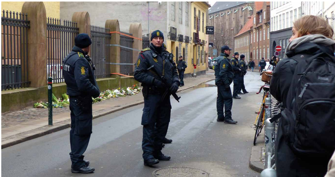
Bevogtning foran synagogen efter terrorangrebet. Også den jødiske skole, Carolineskolen, er fast bevogtet.

Men ideal og følelser kolliderer, når snakken falder på gerningsmanden, som har påført Mette Bentow og familien psykiske traumer og er årsagen til, at børnene i dag lider af PTSD.